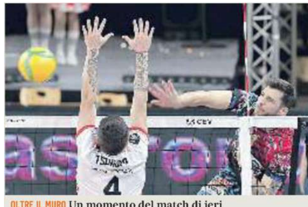
OLTRE IL MURO Un momento del match di ieri

ARTICOLO NON CEDIBILE AD ALTRI AD USO ESCLUSIVO DEL CLIENTE CHE LO RICEVE - 4