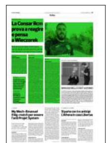
Superficie 43 %