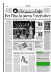
Superficie 2 %

ARTICOLO NON CEDIBILE AD ALTRI AD USO ESCLUSIVO DEL CLIENTE CHE LO RICEVE - 4