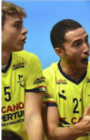
Gollini e Rossini liberi di Modena

Ufficiali le date delle due sfide con il Tours: andata fuori il 12, ritorno il 19 a Modena