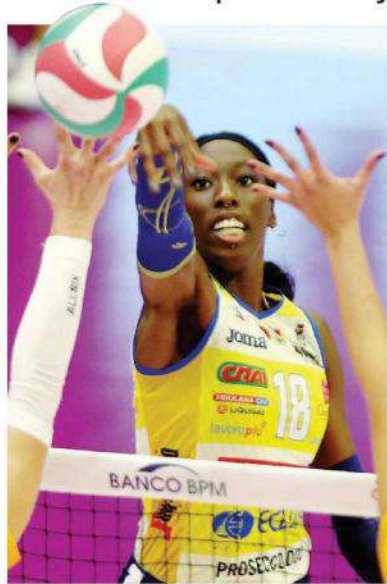
L'azzurra Paola Egonu, 22 anni, leader dell'Imoco Conegliano