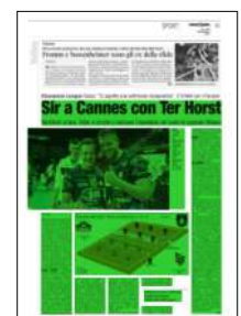
Superficie 59 %