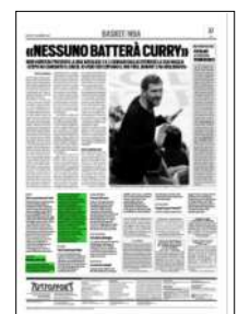
Superficie 3 %

ARTICOLO NON CEDIBILE AD ALTRI AD USO ESCLUSIVO DEL CLIENTE CHE LO RICEVE - 4