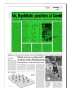
Superficie 44 %