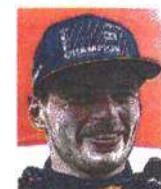
N. Abdel-Aziz su Verstappen

«Ho seguito la rincorsa al titolo mondiale di Max e dopo la vittoria nel GP di Abu Dhabi ho festeggiato»