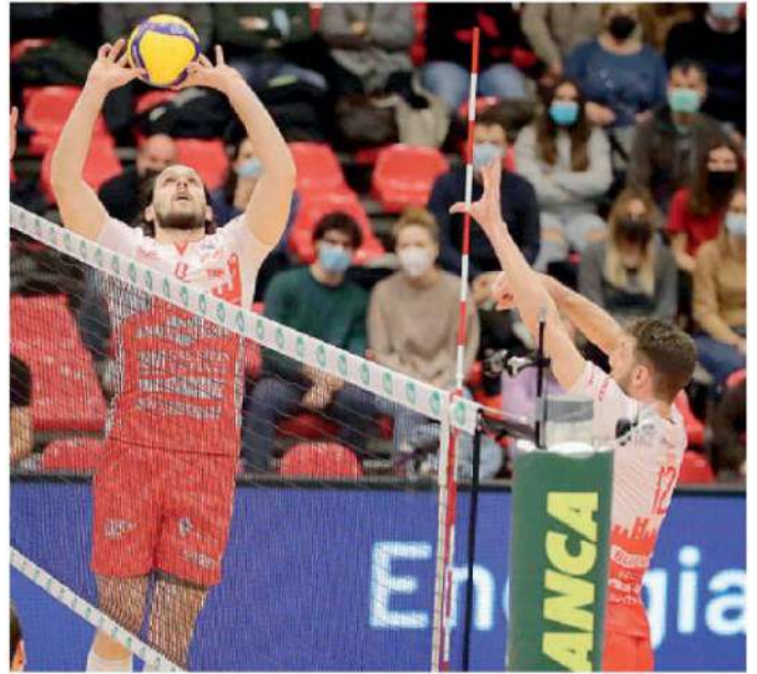
La Gas Sales resterà alla finestra anche nel weekend che avrebbe dovuto chiudere il girone di andata

ARTICOLO NON CEDIBILE AD ALTRI AD USO ESCLUSIVO DEL CLIENTE CHE LO RICEVE - 4