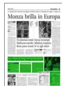
Superficie 17 %

ARTICOLO NON CEDIBILE AD ALTRI AD USO ESCLUSIVO DEL CLIENTE CHE LO RICEVE - 4