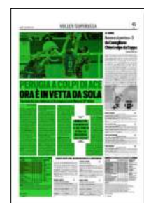
Superficie 49 %