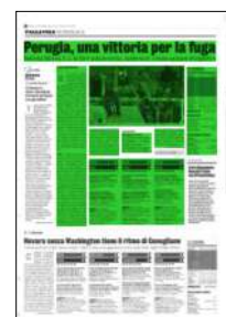
Superficie 47 %

NOTE Durata set: 22', 26', 23'; tot.: 71'. Cisterna: battute sbagliate 10, vincenti 4, muri 12, errori 13. Ravenna: battute sbagliate 12, vincenti 1, muri 4, errori 20. Trofeo Gazzetta: 6 Dirlic, 5 Zingel, 4 Maar, 3 Rinaldi, 2 Baranowicz, 1 Vukasinovic. (die.ro.)