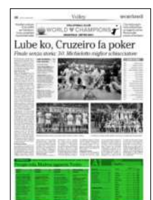
Superficie 19 %

ARTICOLO NON CEDIBILE AD ALTRI AD USO ESCLUSIVO DEL CLIENTE CHE LO RICEVE - 4