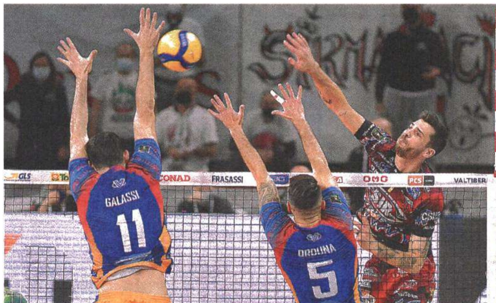
Stella americana Matthew Anderson, 34 anni, schiacciatore statunitense alla prima stagione con Perugia

Monza-Verona Ore 15.30 Civitanova-Perugia (Rai Sport) 18 Taranto-Milano 18 Trento-Cisterna 20.30 Riposa: Ravenna