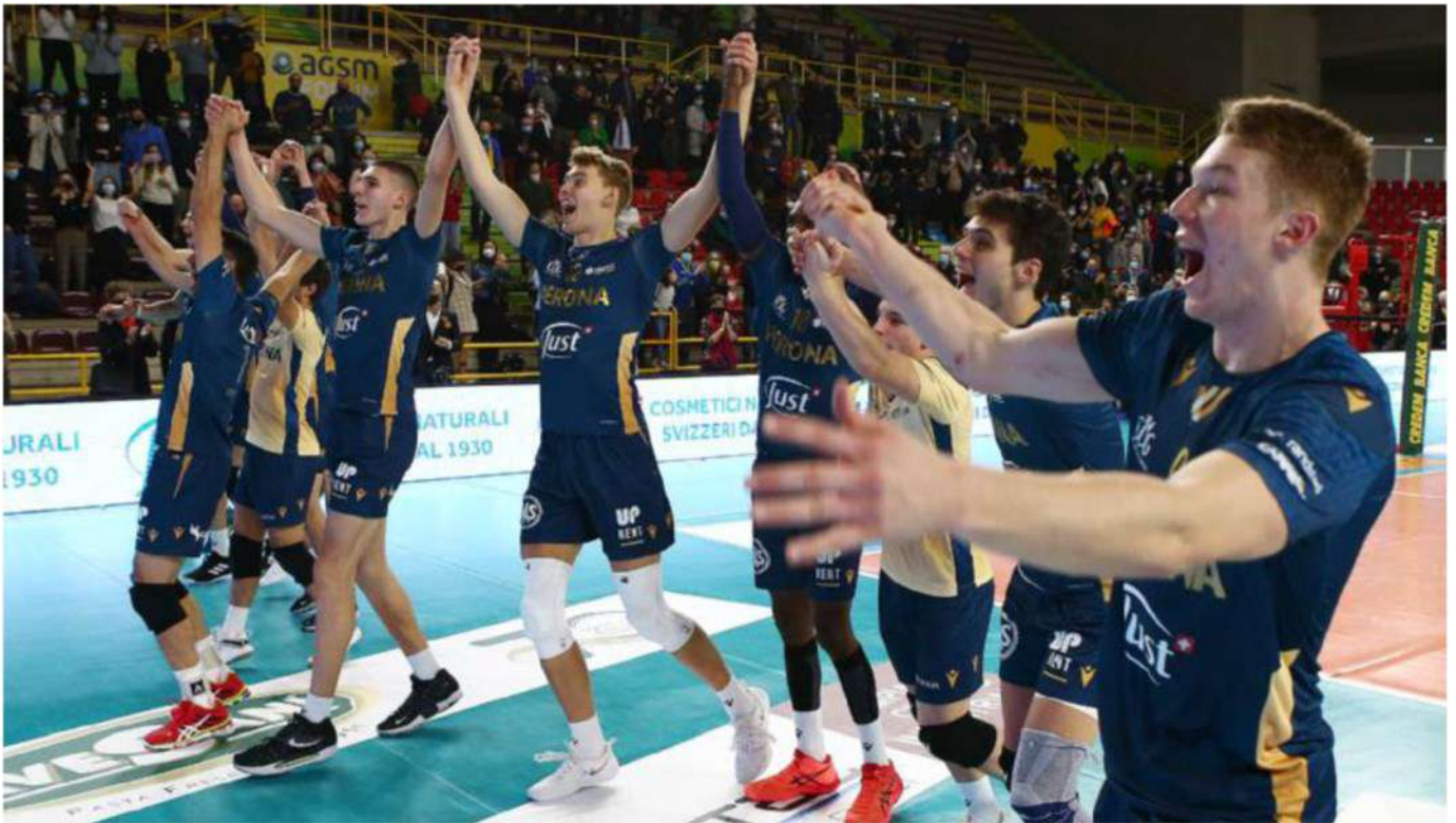
Verona al Forum festeggia la vittoria sulla Tonno Callipo Vibo Valentia

Verona non brilla molto a muro. In questo fondamentale ha una media di muri per set pari a 2,05. In questa classifica si trova quart'ultima davanti a Ravenna, Padova e Taranto. Nei primi tre posti ci sono Perugia, Trento e Lube