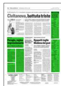
Superficie 32 %

Formula: le prime 8 ai playoff, le ultime due in A2.