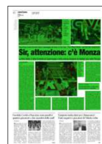
Superficie 54 %

ARTICOLO NON CEDIBILE AD ALTRI AD USO ESCLUSIVO DEL CLIENTE CHE LO RICEVE - 4