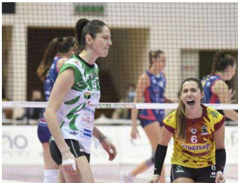
Un momento del match tra Megabox e Scandicci. Troppo forti le avversarie