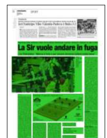
Superficie 61 %