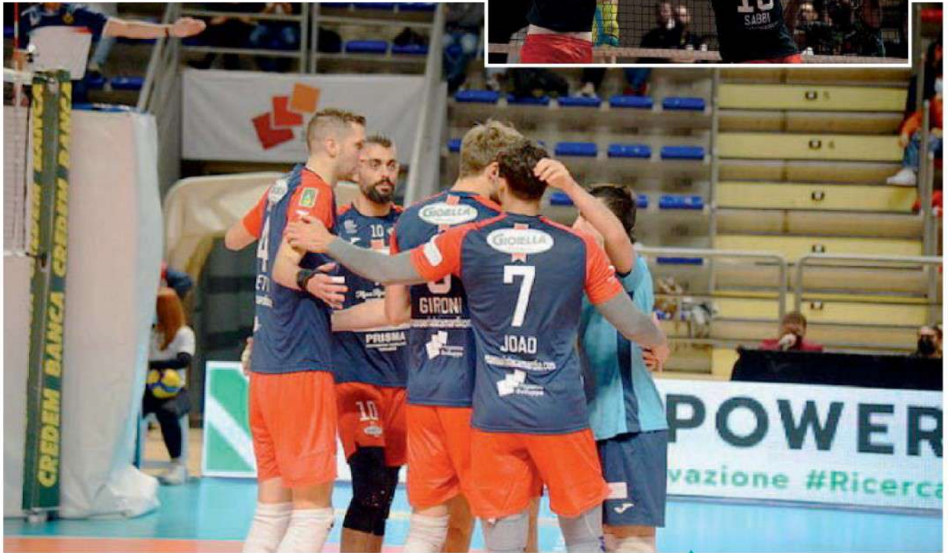
AFFIATATI L'abbraccio dei giocatori della Gioiella Prisma Taranto, che dopo avere battuto la Top Volley Cisterna puntano alla continuità di rendimento e risultati. A partire già da domani nella difficile trasferta di Modena

ARTICOLO NON CEDIBILE AD ALTRI AD USO ESCLUSIVO DEL CLIENTE CHE LO RICEVE - 4