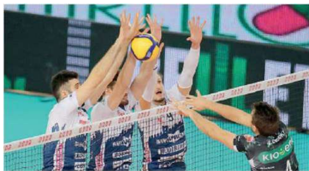
Il muro della Gas Sales domenica contro Padova

Dopo il turno di riposo osservato ieri, tornerà in campo domenica la Gas Sales che sfiderà, al Palabanca, Gioiella Prisma Taranto. Sabato, dalle 16 alle 19, alle casse del Palabanca sarà possibile ritirare le tessere abbonamento e acquistare i biglietti della partita. Contestualmente sarà aperta la prevendita per il match casalingo dell'8 dicembre con Sir Safety Conad Perugia. Domenica invece sarà possibile solamente ritirare abbonamenti e accrediti a partire dalle 14. Questi gli orari della biglietteria: sabato dalle 16 alle 19, domenica dalle 14 alle 15.30. E' inoltre possibile acquistare i biglietti agli sportelli Gas Sales e nelle filiali della Banca di Piacenza. Su Vivaticket è sempre disponibile l'acquisto on line fino ad un'ora prima della partita.