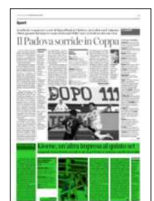
Superficie 23 %

Note: durata set: 30', 22', 25', 31', 20'; totale: 128'