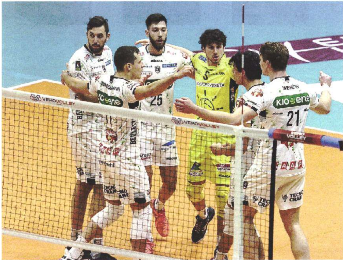
ORGOGGIO BIANCONERO Vincere al tie break in casa di Monza non era assolutamente facile

ARTICOLO NON CEDIBILE AD ALTRI AD USO ESCLUSIVO DEL CLIENTE CHE LO RICEVE - 4