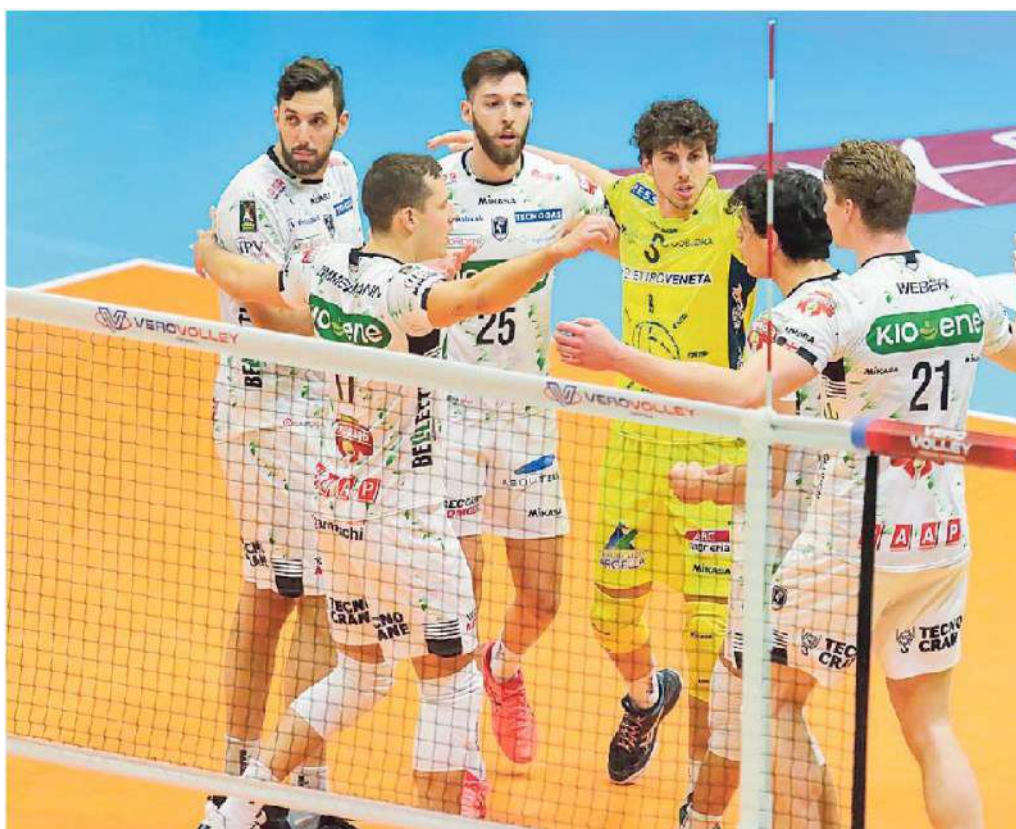
Abbraccio di gruppo Kioene dopo la vittoria del primo set in Brianza

Note: durata set 30', 22', 25', 31' e 20' per un totale di 2 ore o 8'. Servizio: Monza errori 18, ace 7; Padova errori 27, ace 11. Muro: Monza 7, Padova 6. Ricezione: Monza 36% (15% prf), Padova 44% (19% prf). Attacco: Monza 54%, Padova 54%. Errori: Monza 27, Padova 34.