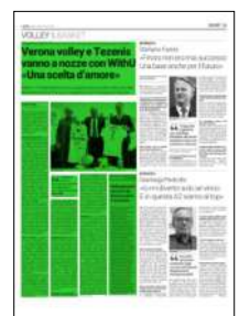
Superficie 41 %

Quindi «resto disponibile a fare la mia parte a patto però di avere una risposta corale. Le cifre sarebbero importanti, certo, ma non infinite per le potenzialità di una città co-