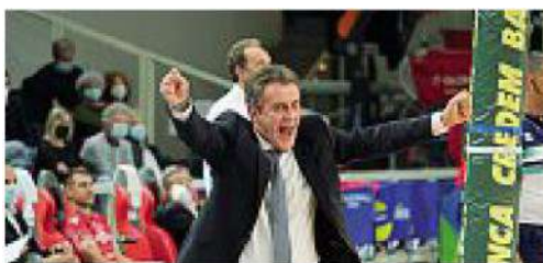
Esultanza La gioia di Lorenzetti