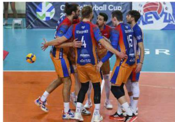
Parte con il piede giusto l'avventura di Monza all'esordio assoluto in Cev Cup

ARTICOLO NON CEDIBILE AD ALTRI AD USO ESCLUSIVO DEL CLIENTE CHE LO RICEVE - 4