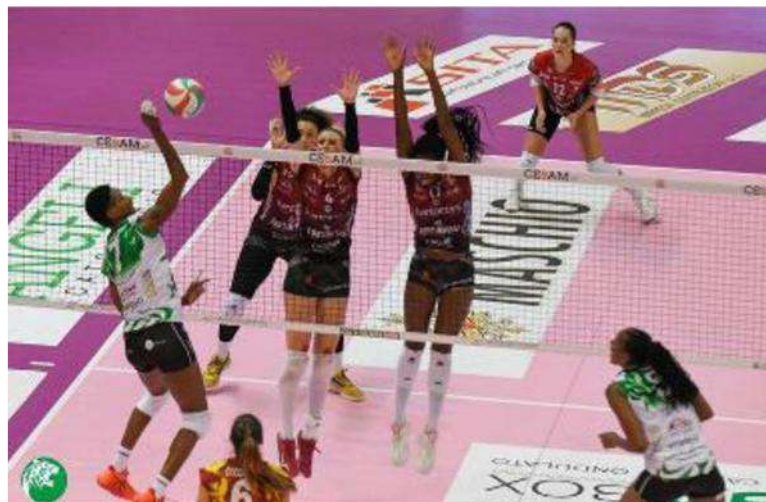
Nell'immagine, la Carcaces in attacco

Ritaglio stampa ad uso esclusivo del destinatario, non riproducibile