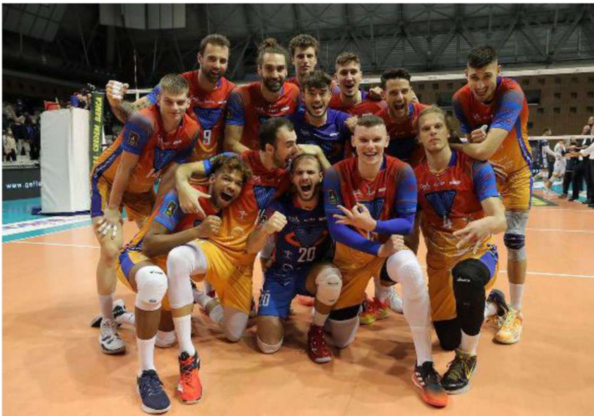
Monza capolista della Superlega , dopo aver schiacciato con un netto 3-0 Piacenza, ospita Civitanova campione d'Italia