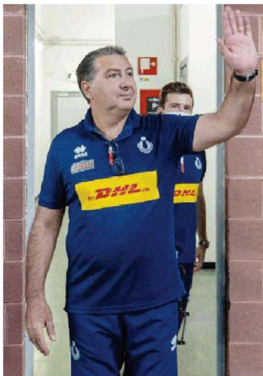
Fefè De Giorgi, 60 anni, ha vinto l'Europeo all'esordio