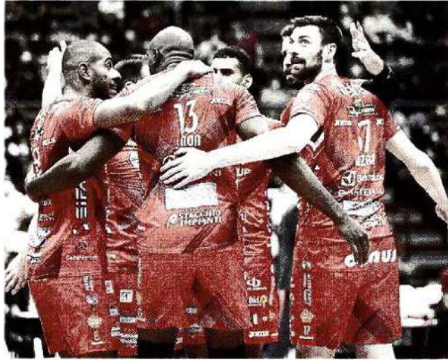
I giocatori della Lube esultano dopo un punto realizzato