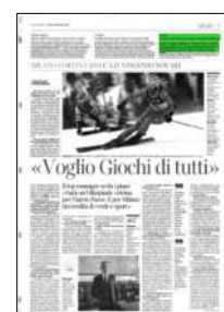
Superficie 2 %

ARTICOLO NON CEDIBILE AD ALTRI AD USO ESCLUSIVO DEL CLIENTE CHE LO RICEVE - 4