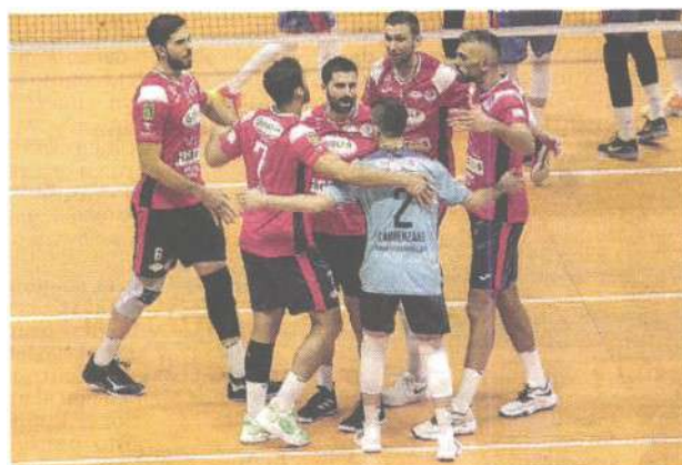
La Prisma esulta dopo un punto a Monza

PROS. TURNO 3 NOVEMBRE Consar Ravenna - Vero V.Monza; Itas Trentino - Kioene Padova; Leo Shoes Modena - Gas Sales Piacenza; Lube Civitanova - NBV Verona; Prisma Taranto - Sir Safety Perugia; Ton.Callipo VV - Allianz Milano. Riposa: Top Volley Cisterna