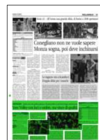
Superficie 29 %