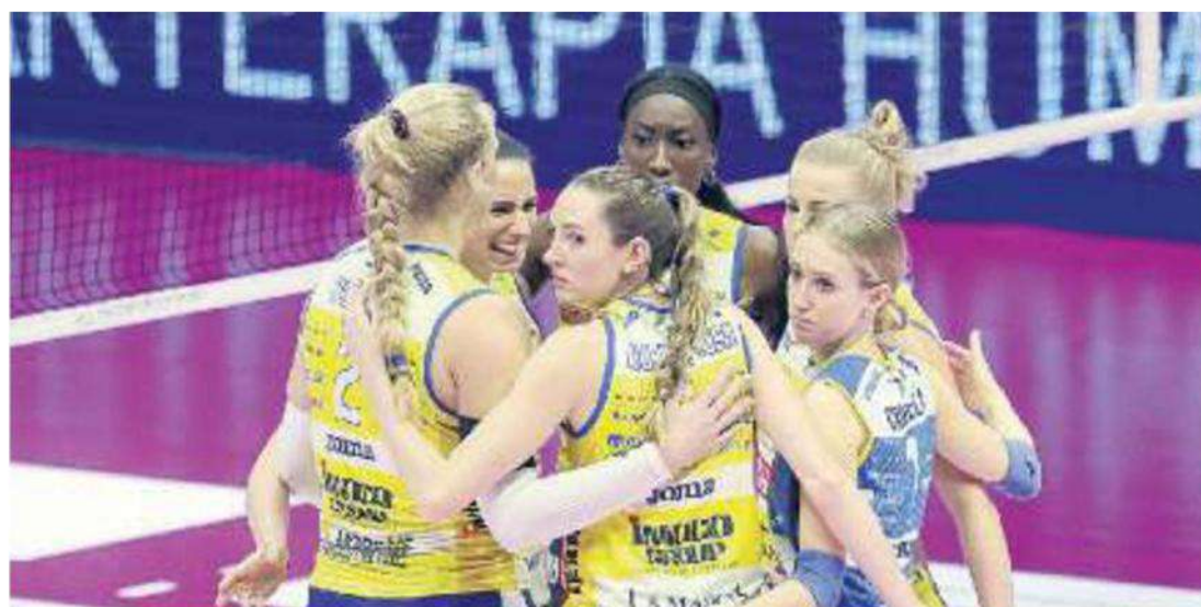
PROSECCO DOC Le ragazze di coach Santarelli hanno sbancato Monza dopo una battaglia di nervi