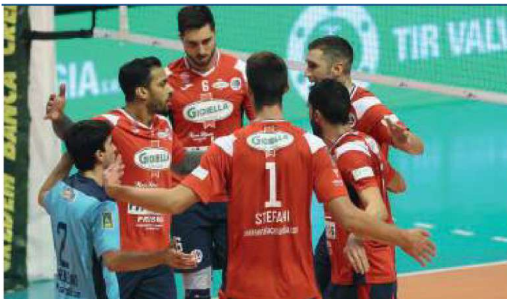
● Riparte la Prisma