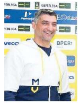
FISCHIO D'INIZIO ALLE 20,30 DIRETTA VOLLEYBALLWORLD.TV INGRESSO POSSIBILE DALLE 19