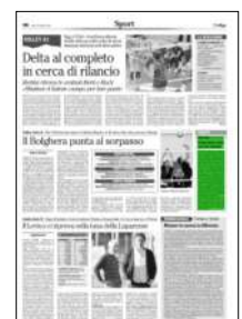
Superficie 3 %

ARTICOLO NON CEDIBILE AD ALTRI AD USO ESCLUSIVO DEL CLIENTE CHE LO RICEVE - 4