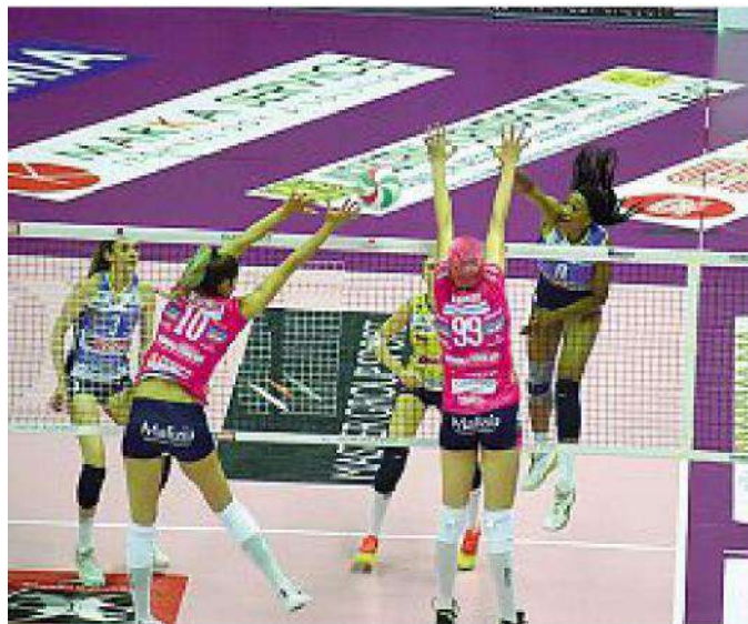
Imoco Dopo quattro vittorie di fila questa sera un impegno non facile

Nella rosa lombarda sono arrivate l'esperta Gennari e soprattutto la bomber Mihajlovic, ad implementare un gruppo che assieme a Busto, Scandicci e Novara vorrà provare a scalzare Conegliano dal trono. Monza fin qui è andata a corrente alternata, ottenendo due vittorie in quattro gare, mentre le Pantere hanno già staccato il resto del gruppo volando in vetta, solitarie in testa alla classifica da imbattute. C'è però da fare i conti con un'infermeria affollata, con Sylla e Fahr ancora fuori, e Plummer e De Gennaro in fase di recupero dopo i rispettivi acciacchi. «Stiamo migliorando fisicamente, dobbiamo avere ancora un po' di pazienza per far rientrare gli acciacchi — dice Daniele Santarelli — ma siamo fiduciosi per il completo recupero, a breve, delle ragazze che hanno avuto problemi fisici in questo periodo. Comunque la squadra sta crescendo sia in allenamento che in partita, c'è