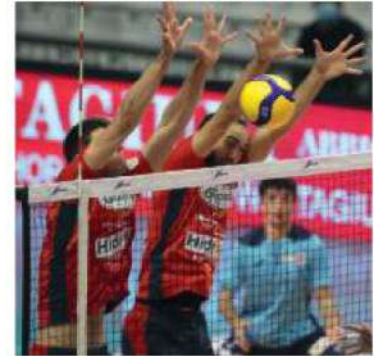
● Quella appena trascorsa è stata una domenica di sosta per la Prisma. Domenica il match contro Monza