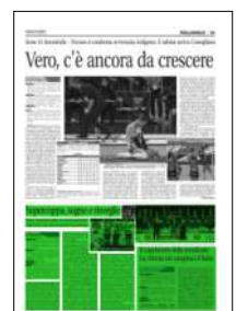
Superficie 28 %

tutti i punti di vista. Perché forse, nemmeno loro, i protagonisti, avrebbero mai immaginato di superare i campioni d'Italia di Civitanova con tanta sicurezza. La semifinale di Supercoppa resterà a lungo nella memoria del Vero Volley perché Monza ha messo in campo fin da subito la giusta grinta, l'orgoglio, l'attenzione e l'intelligenza necessarie per togliere i riferimenti a Civitanova e volare sul 2-0 dopo due set (22-25 nel primo e addirittura 16-25 nel secondo). I padroni di casa hanno abbozzato una reazione nel terzo sfruttando la poca continuità di Monza, ma nel quarto i ragazzi di Eccheli hanno riportato l'inerzia dalla propria parte vincendo la sfida.